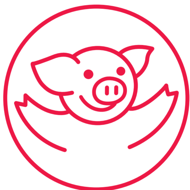
支持及建立經濟圈