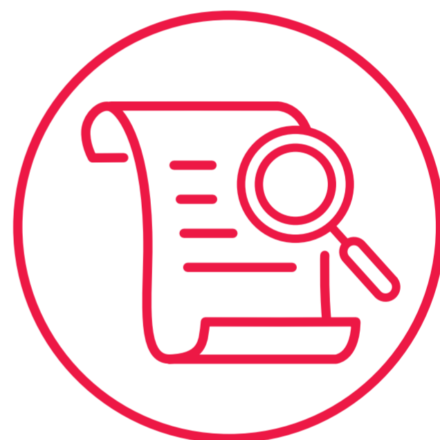
保存真相，講真歷史