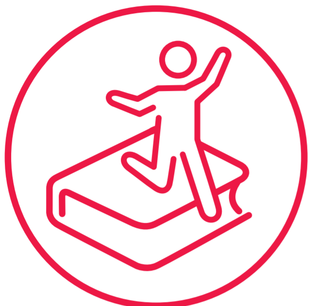
體制外的通識教育